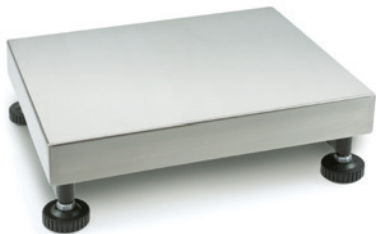
Plate-formes KERN KFP · KXP