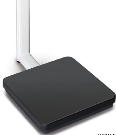
KERN MPB-P con soporte