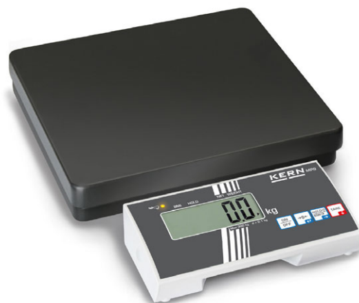
KERN MPB con indicador desocupado