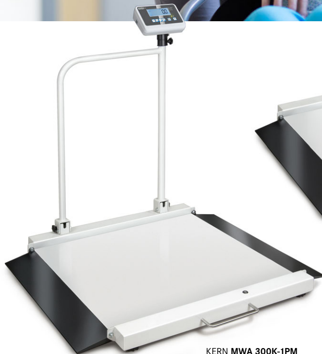
KERN MWA 300K-1PM