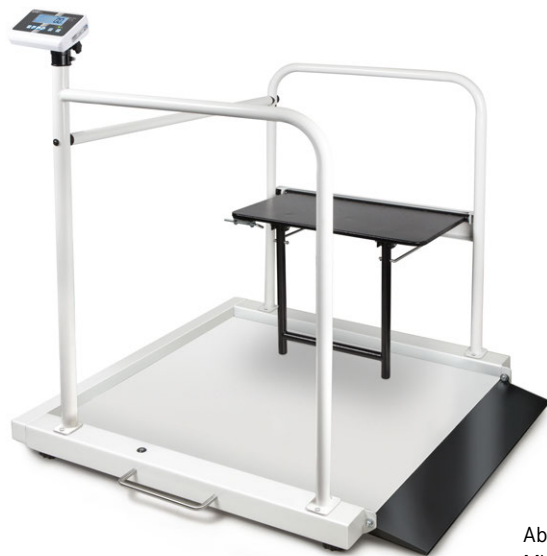
Abb. zeigt MWA 300K-1M + MWA-A04

Rollstuhlwaage mit integrierter Auffahrrampe und Haltebügel-Set mit klappbarem Patientensitz – mit Eich- und Medizinzulassung für den professionellen, stationären Einsatz in der medizinischen Diagnostik