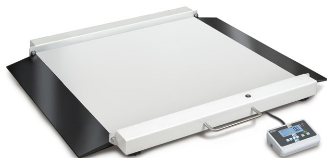
KERN MWA 300K-1M