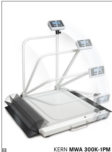
KERN MWA 300K-1PM